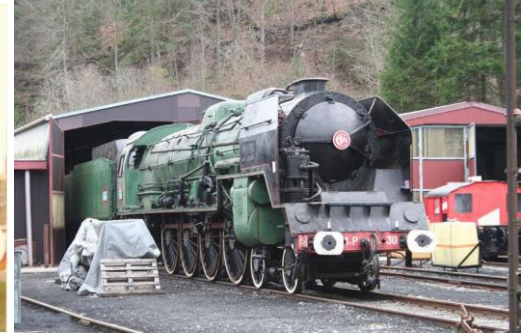
Etat actuel de la machine à St Sulpice