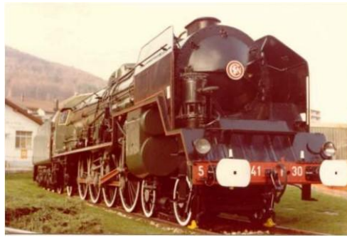
En monument à Vallorbe 1972-1997