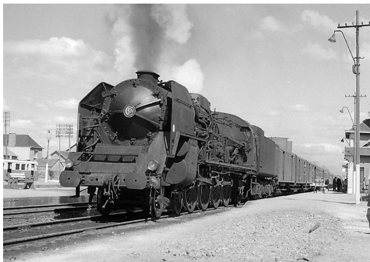
241P 30 - Rosporden - 28 juillet 1968