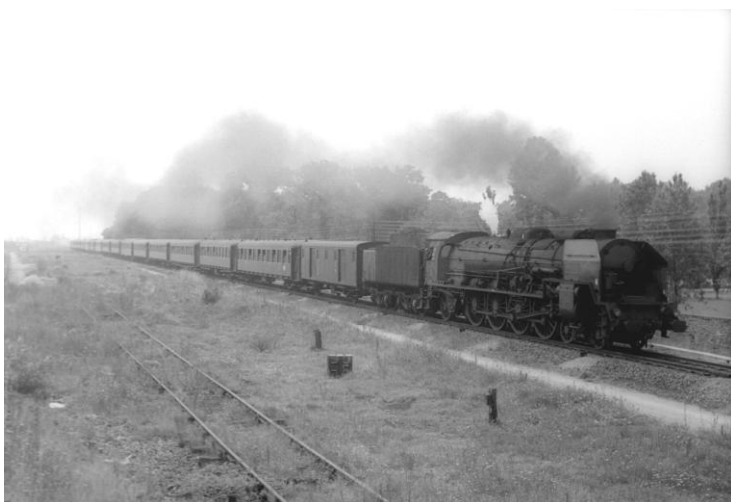
241P 30 - Nantes - 31 juillet 1968

Cette magnifique locomotive, du type 241 « Mountain » a été construite en 1951 pour le compte de la SNCF par les Ets Schneider au Creusot. Appartenant à une série de 35 machines, la 241P 30 est à ce jour stationnée à St Sulpice dans le Jura Neuchâtelois en Suisse, et est propriété du Chemin de fer Vapeur-Val de Travers (VVT) qui souhaite s'en séparer.