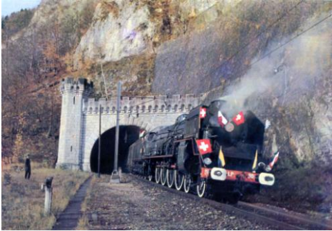
Arrivée à Vallorbe en 1972

En juillet 1999, elle fut déplacée par rail à Pratteln (Suisse). En 2003, le Vapeur val de Travers (VVT), se porte acquéreur de la machine qui, en juillet de la même année, est remorquée jusqu'au dépôt du VVT à St Sulpice près de Neuchâtel.